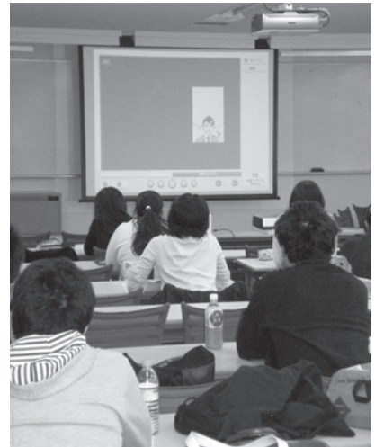
北海道医療大学教室

導入期の学びは、出会いのワーク、DVD視聴、グループワークを行う中で緊張がほぐれ、少しずつ笑顔が増えていった時間でした。