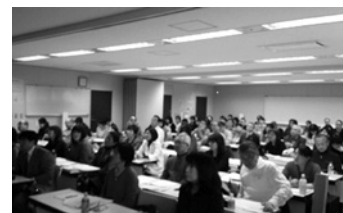
各部からの説明の様子