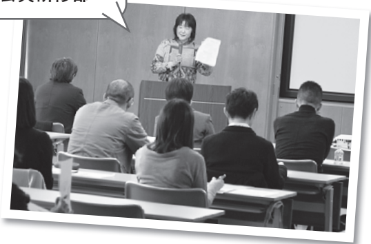
支部育成システム=ロードマップ=の説明

みなさん一生懸命にメモをとりながら説明に聞き入っています 後ろ姿ですが…真剣なまなざしです