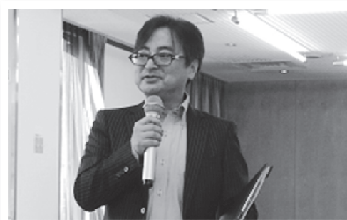
大塚会員部長の ホワイトかふえ オープン宣言!