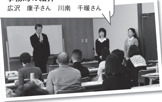
ロードマップ説明会のあとは…