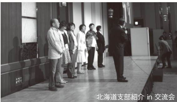
北海道支部紹介 in 交流会

17時から行われた交流会では、500人を超す多くの出席者のもと、北海道支部のメンバーも挨拶をしました。