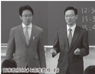
冨家教授(左)と森准教授(右)

2017(平成 29)年度の北海道医療大学での養成講座(2017年4月~10月)が、4月8日(土)、25名の受講生を迎え無事開講しました。