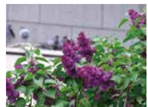
会員作品:ライラックまつり

今月、中部支部での全国研究大会が開催されます。当支部からも数名参加致します。来年の当支部での大会開催に向け大会旗が引き継がれる事と思います。