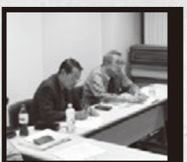
▲小原会長との会議

新メンバーを増員し、全国研究大会実行委員会発足 支部総会の後、交流会会場にて視察を兼ねた懇親会