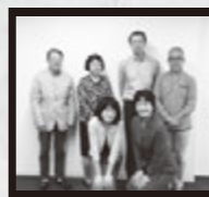
▲プロジェクトチーム