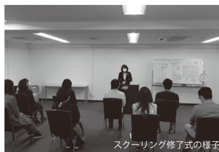
スクーリング修了式の様子