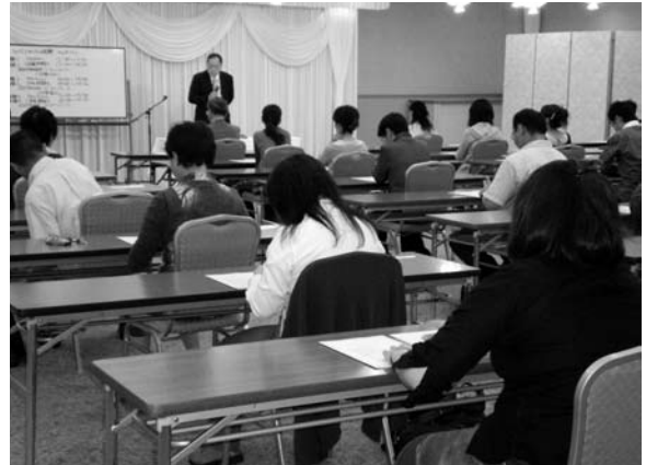
8月30日 CC 試験

8月30日(土)キャリア・コンサルタント試験が行われ、全国で1629名、札幌地区では29名が資格取得を目指し、学科試験1(学識問題 90分) 学科試験2(記述問題 45分) 学科試験3(記述論述 40分)に挑戦されました。年々、問題の専門性が高まり、かつボリュームが多いため、本年は例年と比較し試験時間中の途中退席者が少なかった(試験会場責任者の話)とのこと。現在、キャリア・コンサルタント職種の技能検定(国家資格)が始まろうとしております。